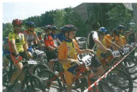
Na startu obeh vzponov in dirke je bil prek 100 kolesarjev.