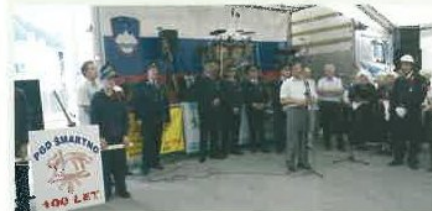
Ob 100-letnici je gasilce v Šmartnem nagovoril tudi minister za obrambo Karl Erjavec