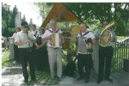
Za prijetno razpoloženje pred razglasitvijo najboljših so poskrbele pevke in muzikantje