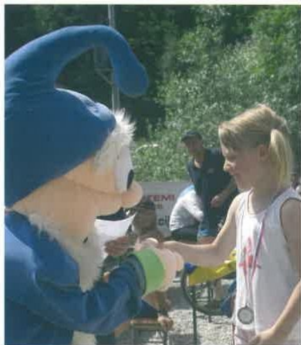
Najmlajšim najboljšim je čestital tudi palček Snoviček.