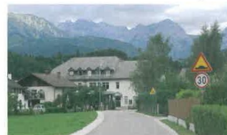
Za vamo pot: pločnik od gasilskega doma do šole