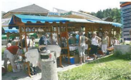
Na stojnicah so članice društva ponudile dobrote iz Tuhinjske doline.